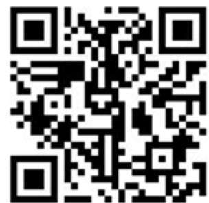
参加申込 QR コード